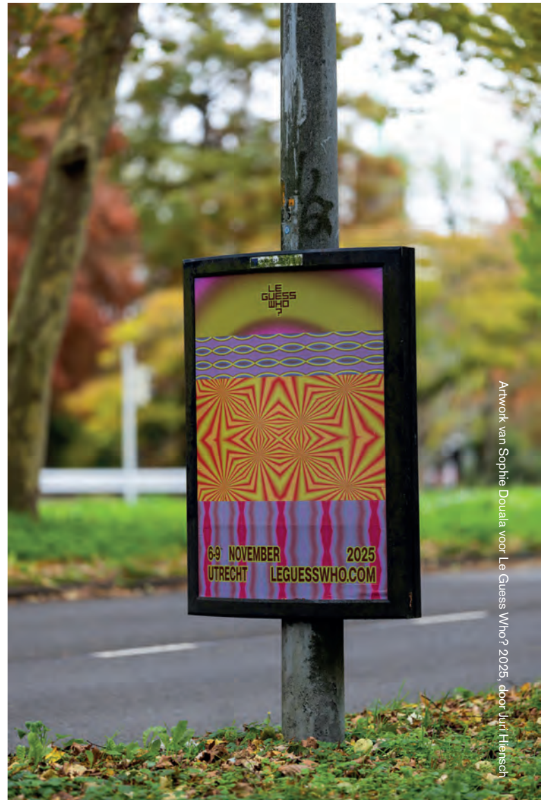
Artwork van Sophie Douala voor 'Le Guess Who? 2025', door Juri Hiensoh

Verder publiceerden we aan het begin van het jaar een bericht op Instagram waarin we onze zorgen deelden over de snelle achteruitgang van alles wat eigendom is van Meta. We zeiden dat we ons gebruik van sociale mediaplatformen die eigendom zijn van Meta terug te schroeven en vroegen onze volgers welke platformen zij het liefst gebruiken om op de hoogte te blijven van alles wat met LGW te maken heeft. We kregen hier veel positieve