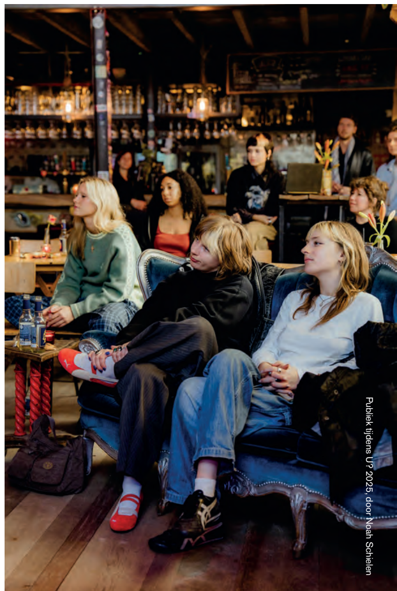
Publiek tijdens U? 2025, door Noah Schielen

Met Le Feast blijven we momenten creëren waar het publiek van LGW en U? samenkomen. Le Feast is een manier om mensen bij elkaar te brengen door middel van gezamenlijke maaltijden. In 2025 breidde Le Feast uit met een nieuw format: voor het eerst organiseerden we,