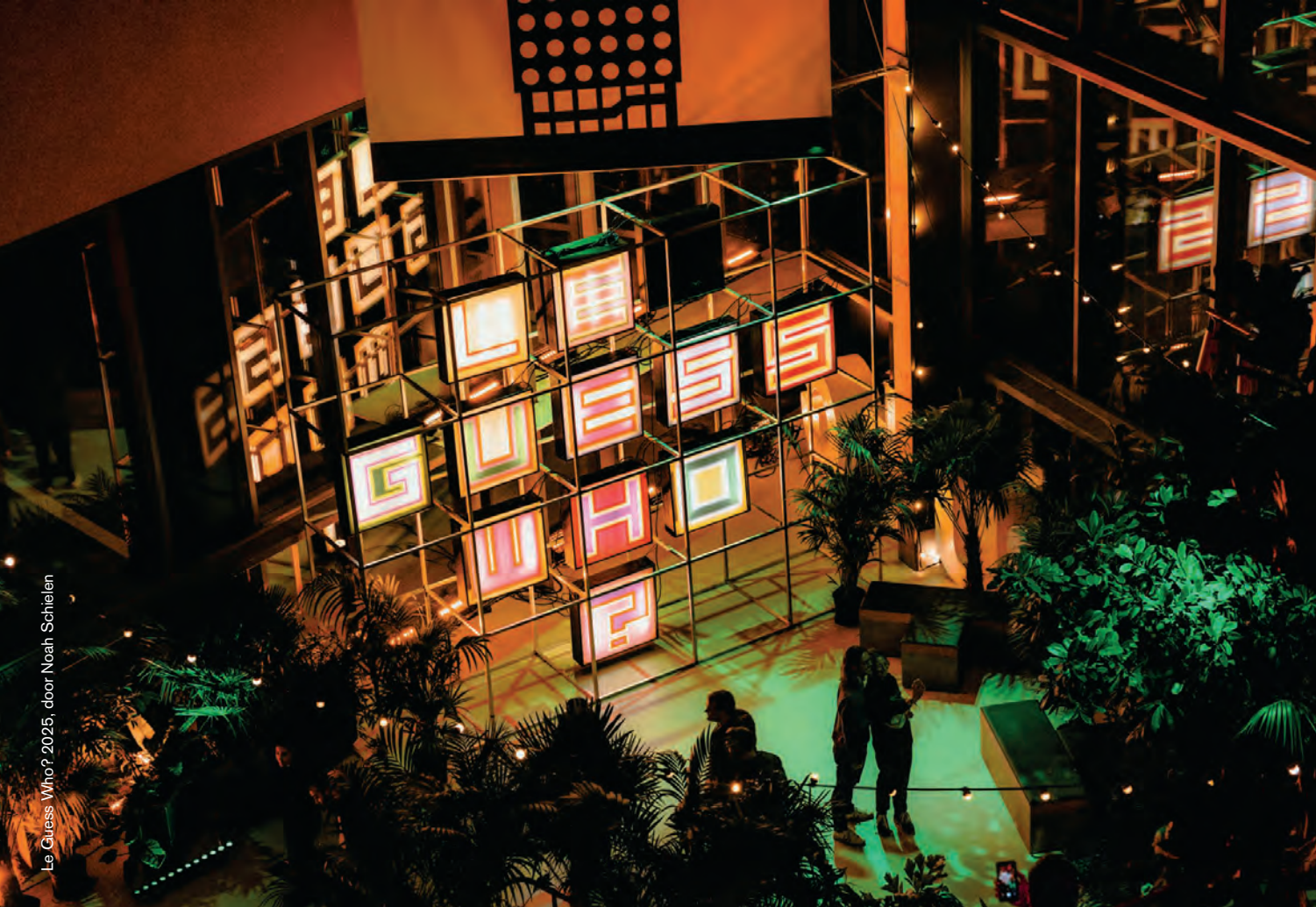
Le Guess Who? 2025

artiesten en crew, en liepen er social safety teams rond op alle festivallocaties. In 2023 was 49 procent van de bezoekers op de hoogte van de aanwezigheid van het Social Safety Team, in 2024 was dat 59 procent en in 2025 is dat gestegen naar 64 procent. Naast een Social Safety Hub op LGW, was er voor het eerst ook een hub op U?. Op deze locatie moeten we in de toekomst werken aan de zichtbaarheid en bekendheid van de hub. Van de bezoekers was 34 procent op de hoogte van de aanwezigheid van het Social Safety Team & Hub en wist 23 procent van tevoren waarvoor het team bedoeld was.