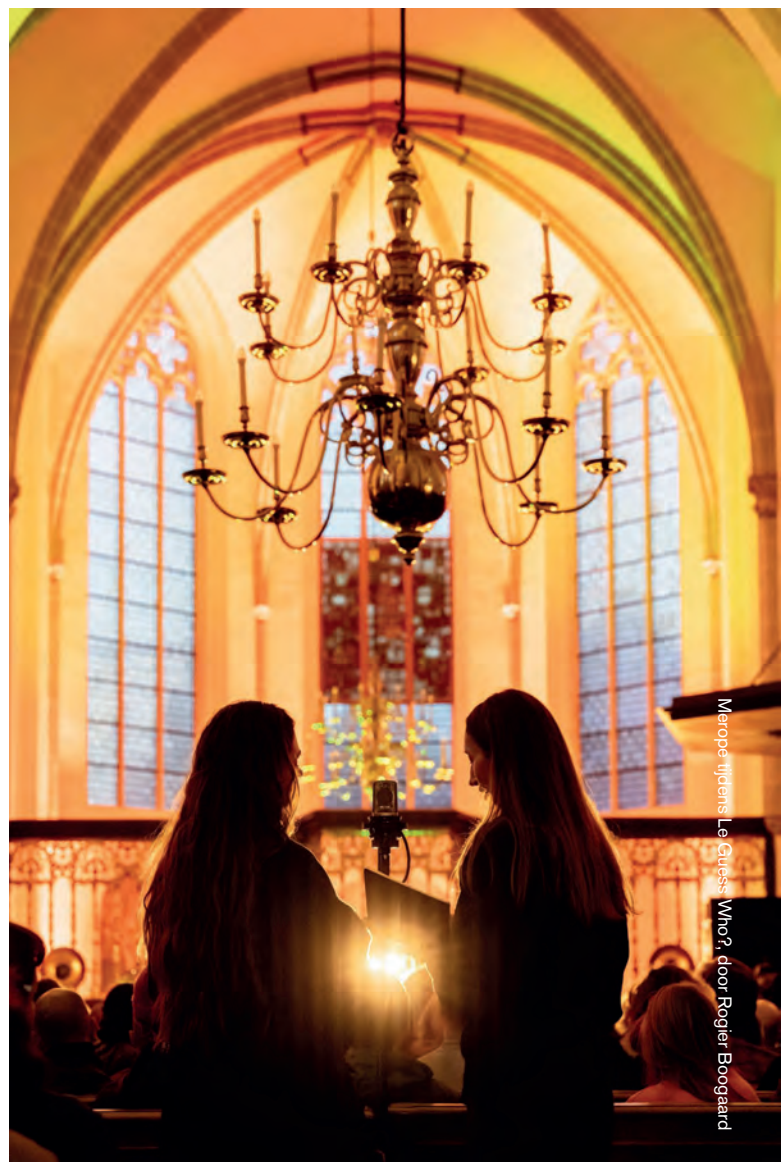
Meropje tijdens Le Guess Who?

Al jarenlang werken we doorlopend aan het verbeteren van de toegankelijkheid van ons festival. Zo werken we met de Mobility Pass, een pas die toegang biedt tot de liften van TivoliVredenburg en - waar mogelijk - voorrang