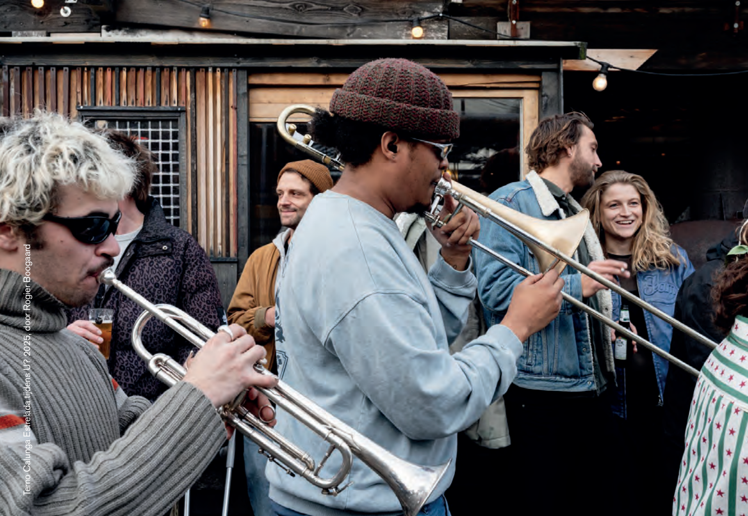
Terno Calunga, Estrelada U? 2025, door Rogier Boogaard